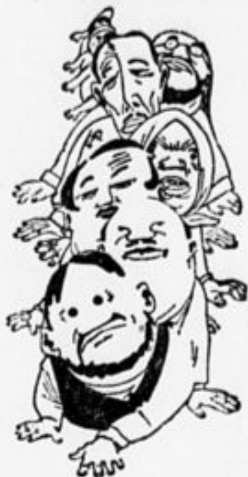
Морды классовых врагов.