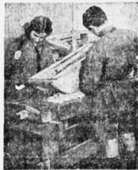
Зима на дворе. Делают санки.

Рассказывайте о «ДЮП» неорганизованным ребятам! Сообщайте «ДЮП» все случаи эксплуатации ваших товарищей!