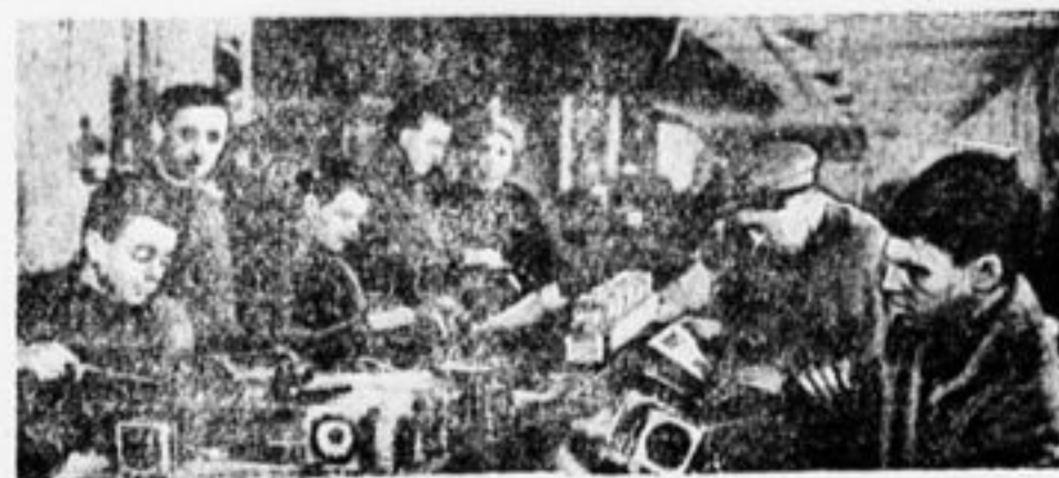
За сборкой приемника.

соревнования — кто скорее прокатится определенное расстояние. На нашей фотографии состязание «рейнских колес» на 50 метров.