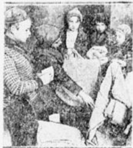
Сборщики мешков пионербазы ОГПУ.

Надо в каждом дворе устроить специальные ящики для бумаги, для железного лома, костей и т. д. Надо повести борьбу за то, чтобы ценный мусор выбрасывался не в помойную яму, а в эти ящики, надо вести агитацию за сбор отбросов. Ценным мусором будем удобрять почву советского хозяйства, будем увеличивать вывоз за границу товаров востребованного значения.