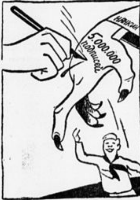
Товарищам нашим должны мы помочь. — Не трогай наших! Руки прочь!