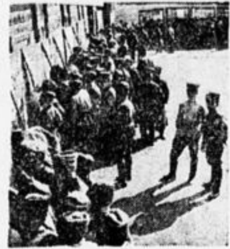
ОДВА. Бойцы осматривают выставку по истории гражданской войны.

Прочитав приказ в «Пионерской Правде» о посылке меморандума шанхайскому правительству, база кустарей гор. Мелитополя в 120 пионеров решила собрать среди неорганизованных ребят и отряда 600 подписей и начать