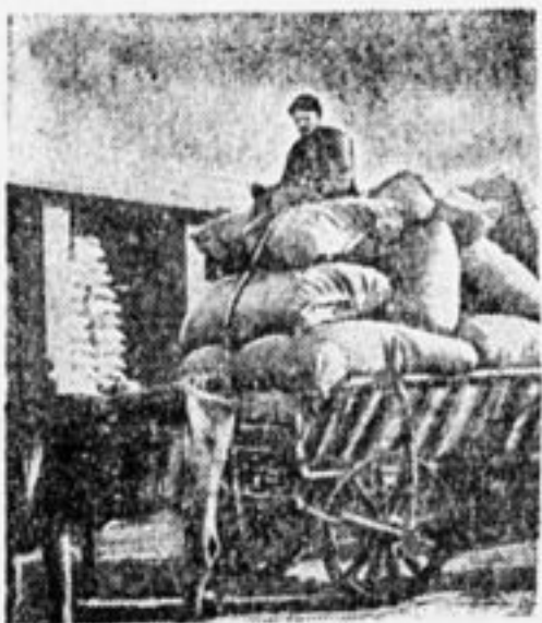
Крестьяне подвозят хлопок-сырец к фабричным складам.

В конце того же века ткач Самуил Кромптон усовершенствовал эту машину и назвал ее «Мюль». Позднее ее усовершенствовали и