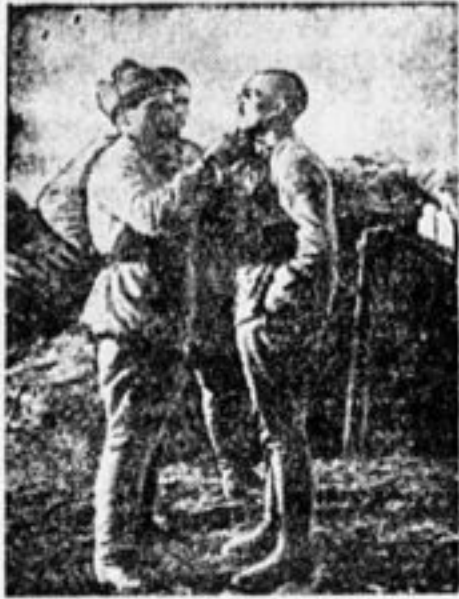
ОДВА. Паринмахерская у окопа.