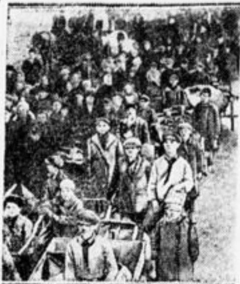
Елань. Пионерский обоз железного лома.