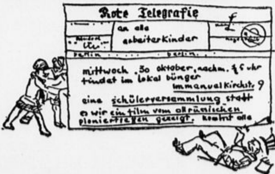
Агитационная листовка немецких пионеров.

Дорогие товарищи, советские работницы, знайте, что многие из нас решили пожертвовать своими жизнями за освобождение поработанных рабочих и беднейших крестьян Японии.