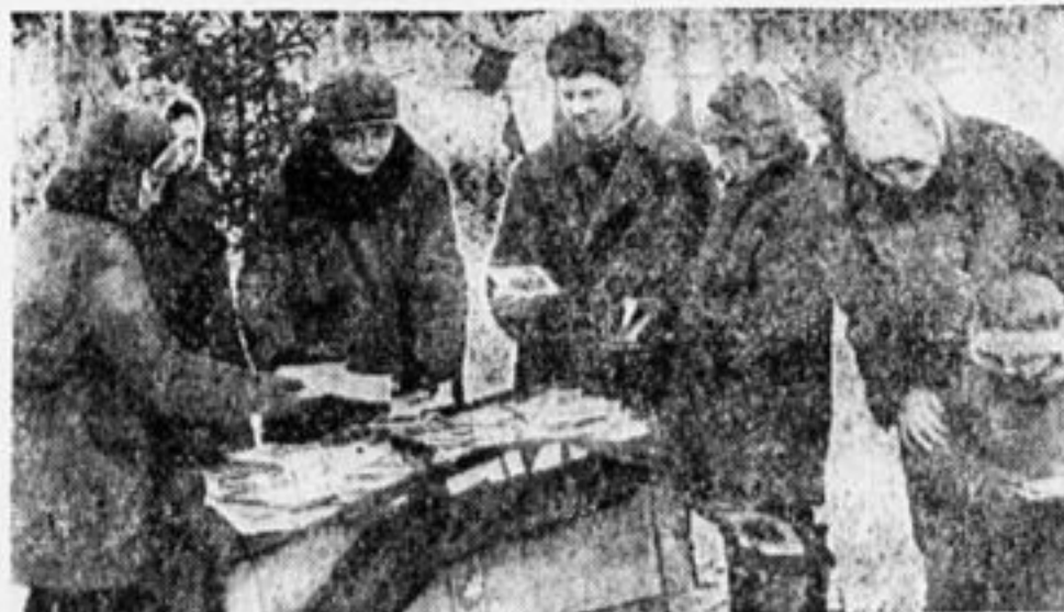
Передвижная продажа книг в жилтовариществе (Шаболовка).

ПИОНЕРЫ И ШКОЛЬНИКИ БАУМАНСКОГО РАЙОНА, ЭПС ПРИ ЦЕНТРАЛЬНОМ ДОУ ЮНЫХ ПИОНЕРОВ, БАКУНИНСКАЯ, 4/6. ПРИНИМАЕТ ЗАЯВКИ НА ПОСЕЩЕНИЕ МОСКОВСКОГО ПЛАНЕТАРИЯ ЕЖЕДНЕВНО С 10 ДО 1 ЧАСА ДНЯ И С 2 ДО 3 ЧАСОВ.