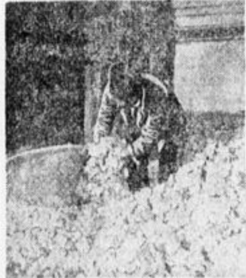
Хлопкоочистительный завод (Азербайджан). Сортировка хлопка.

Наша текстильная промышленность получит дешевый хлопок;