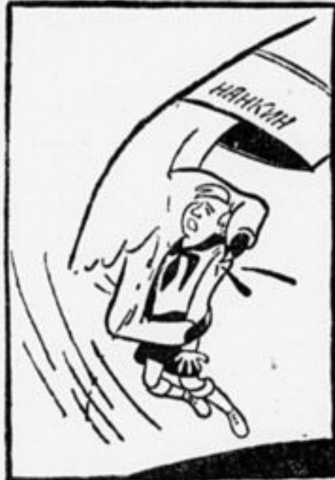
Советов враг, генерал-гад зажал в кулак рабочих ребят.